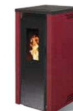
Bordeaux - RAL 3004