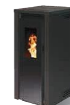
Noir - RAL 9005