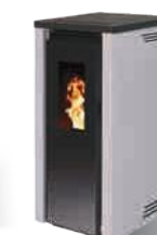
Gris - RAL 9023