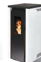
Blanc - RAL 9003