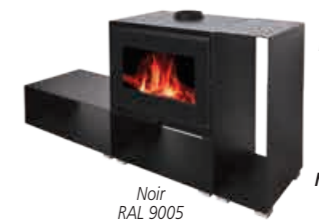
Noir RAL 9005